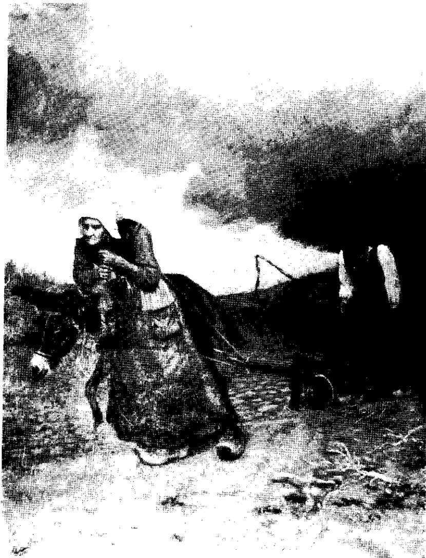
La vieille laboureuse , non signé, Legs Edme Richard, 1969