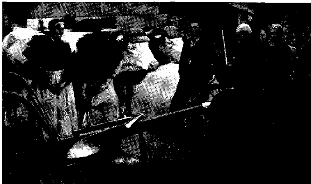
FERNIER R., La Bénédiction de la charrue , 1935