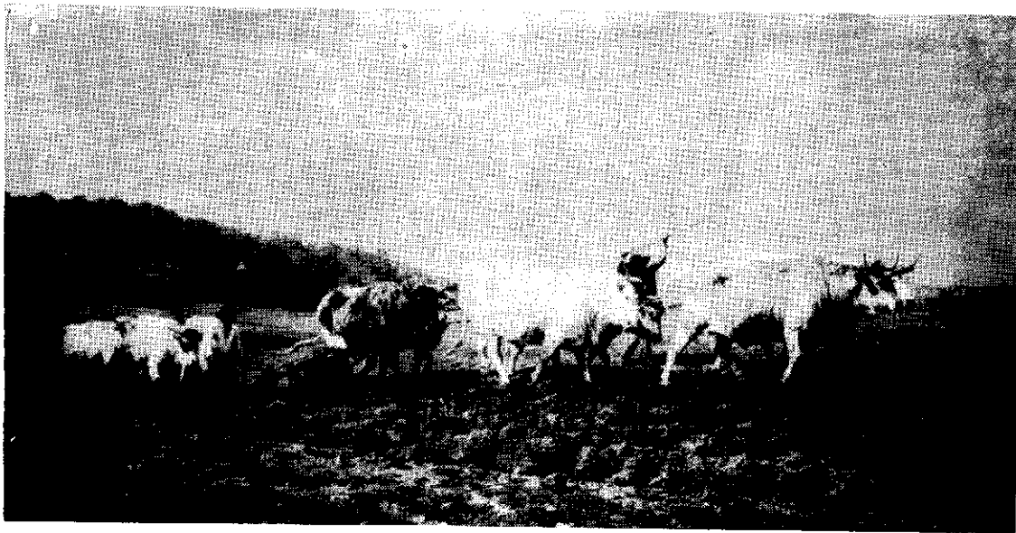
BONHEUR R., Le labourage en Nivernais , in L'Illustration , 13-05-1922