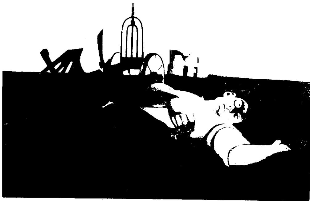
JANNOT H., L'homme à la charrue , 1937